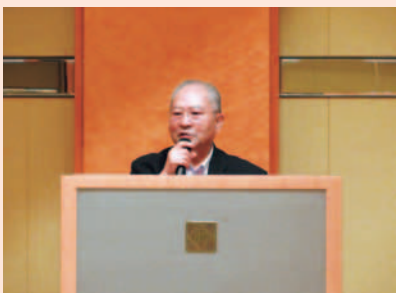
山条会長閉会挨拶