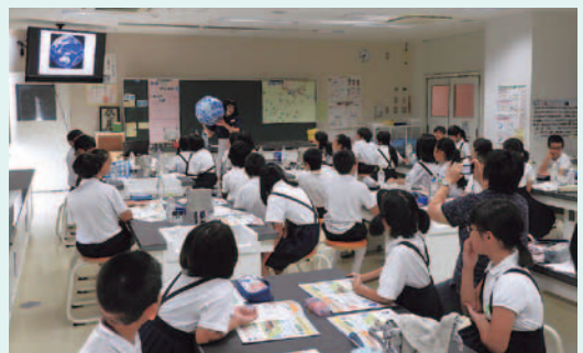
東かがわ市立大内小学校