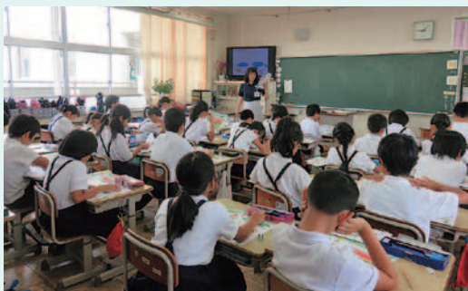
三木町立白山小学校

この環境教育は、香川県環境森林部環境政策課が実施する「体験型環境学習プログラム実施事業」の一環で、平成28年度より「環境キャラバン隊」として当協会が実施しているものである。