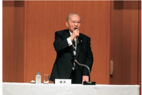
第1部 山条会長あいさつ