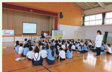
高松市立川添小学校

この水環境出前講座は、高松市都市整備局下水道部下水道経営課が主催する環境学習で、今年度より高松市からの委託事業の一環として当協会が実施しているものである。