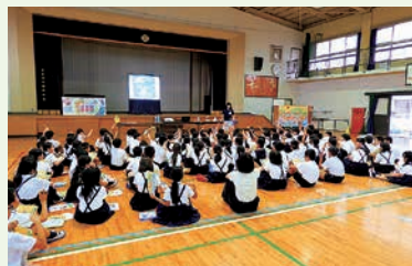
高松市立中央小学校