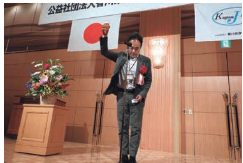
第2部 乾杯の音頭 廃棄物対策課 平池課長