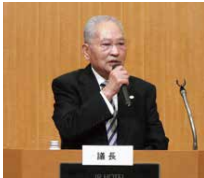
第1部 山条会長あいさつ